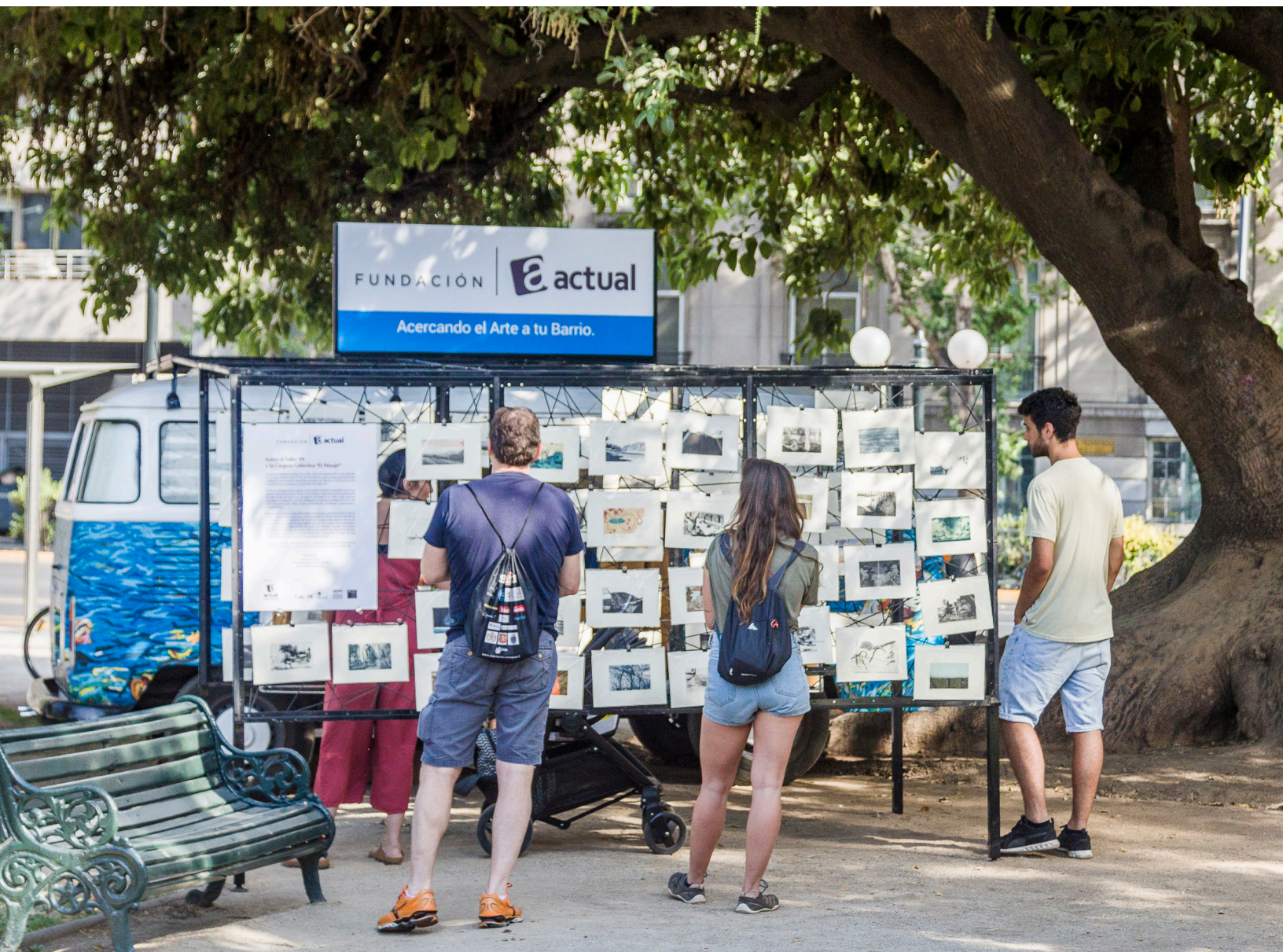
Arte sobre Ruedas | Exposición "Paisaje, Taller 99" | Bibliotecas al Parque, Providencia