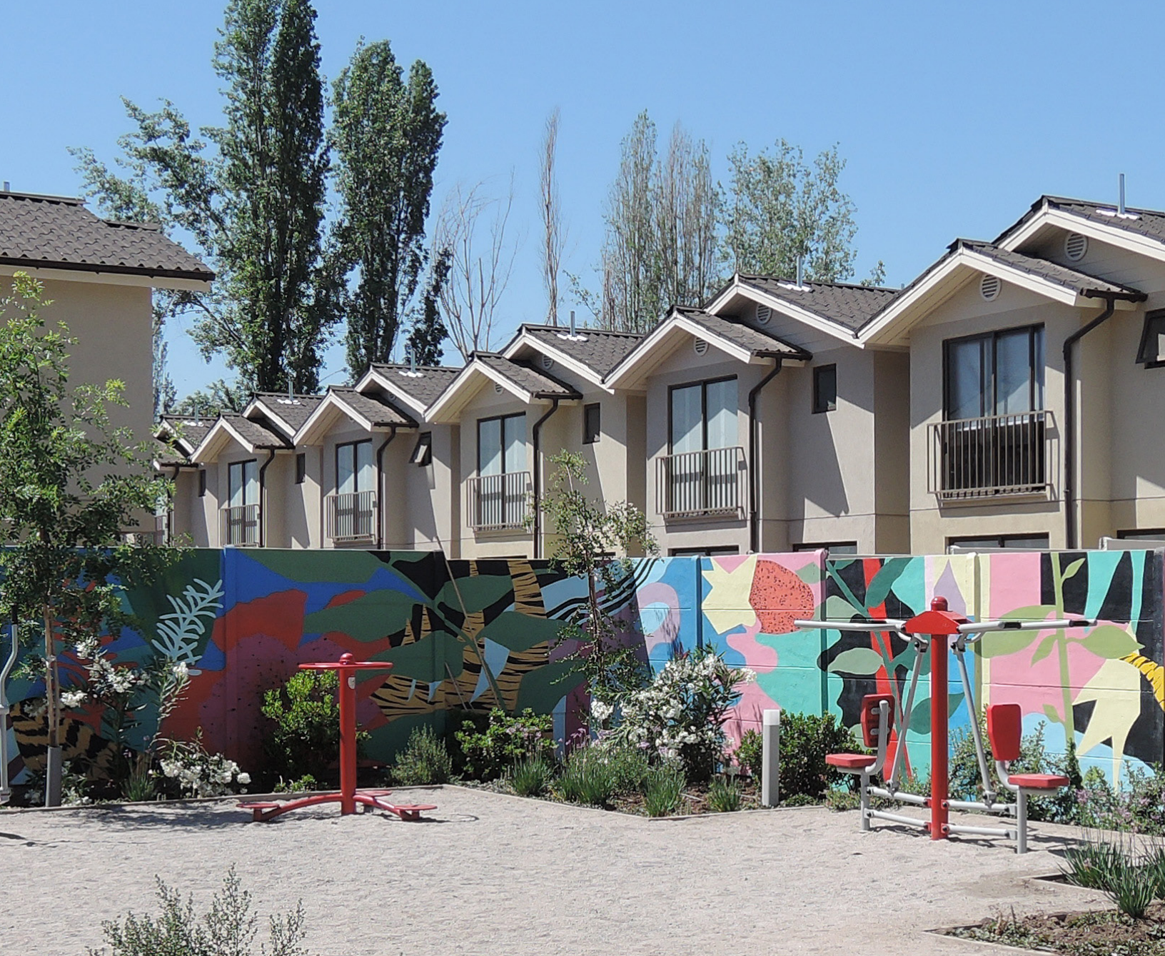
Arte en tu Barrio | Mural "Descanso Tropical" | Huechuraba

“ Encuentro buenísimo que instalen obras de arte en comunidades. Les da un toque al espacio y quita la monotonía. Estos trabajos alegran la vista y mejoran la calidad de vida. Además, así llevan cultura hasta nuestras casas ”