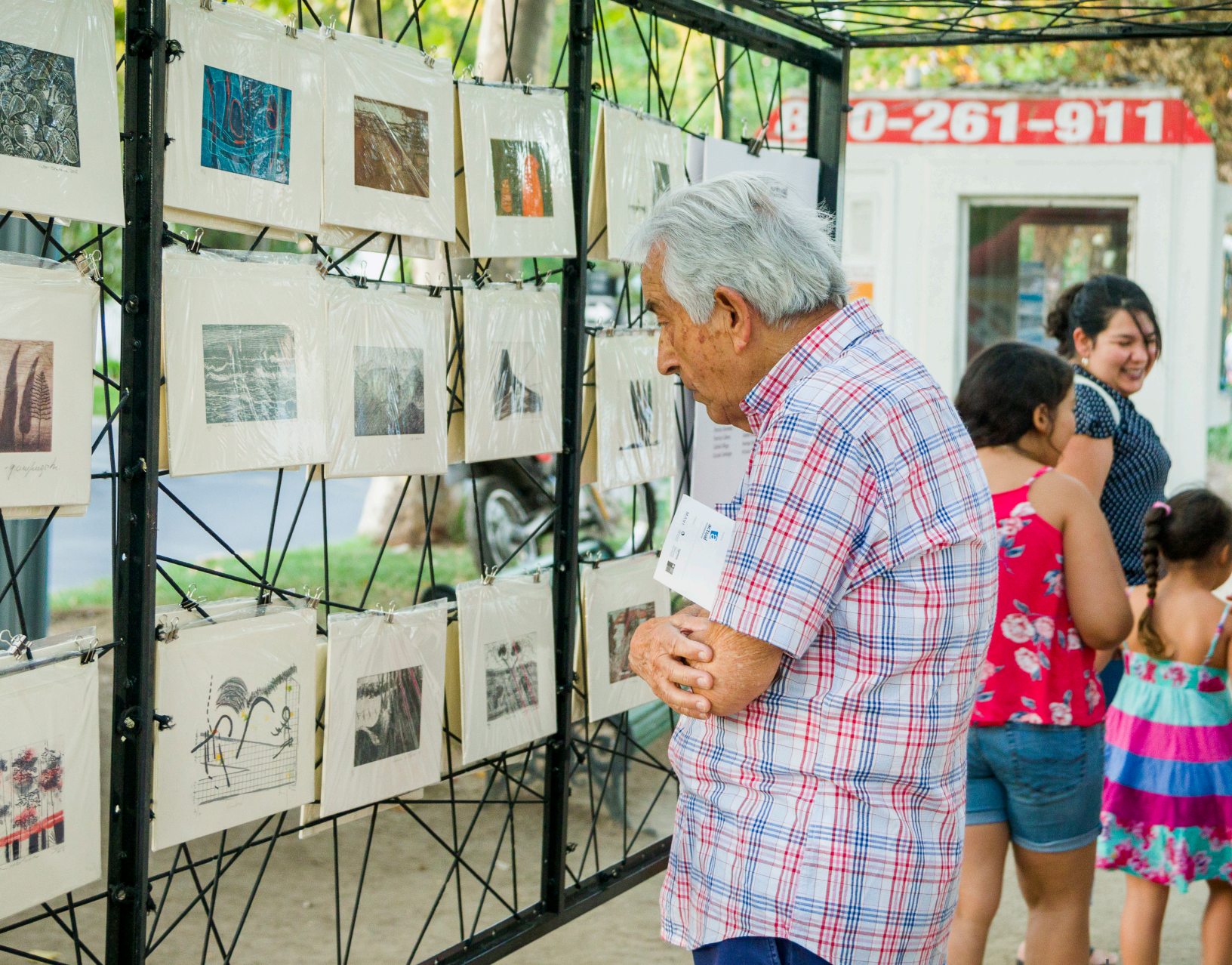
Arte sobre Ruedas | Exposición "Paisaje, Taller 99" | Huechuraba

“ Muchas gracias por entregarnos y mostrarnos el arte de otra manera. Esto es entregar cultura de verdad y para todos ”