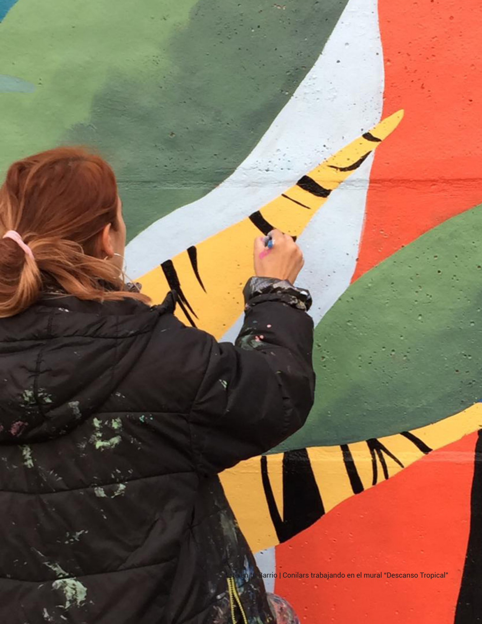
Vive en tu Barrio | Conilars trabajando en el mural "Descanso Tropical"