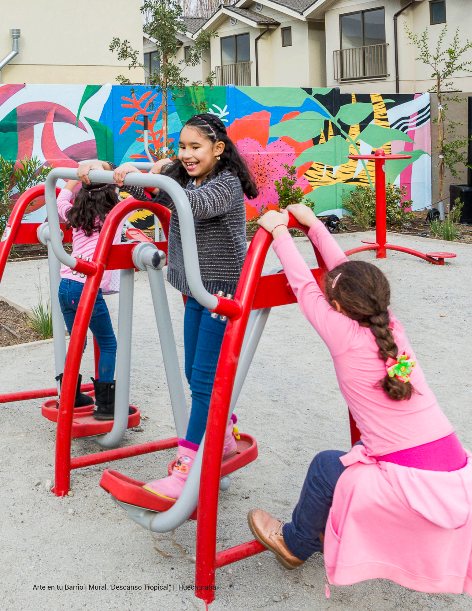
Arte en tu Barrio | Mural "Descanso Tropical" | Huechuraba