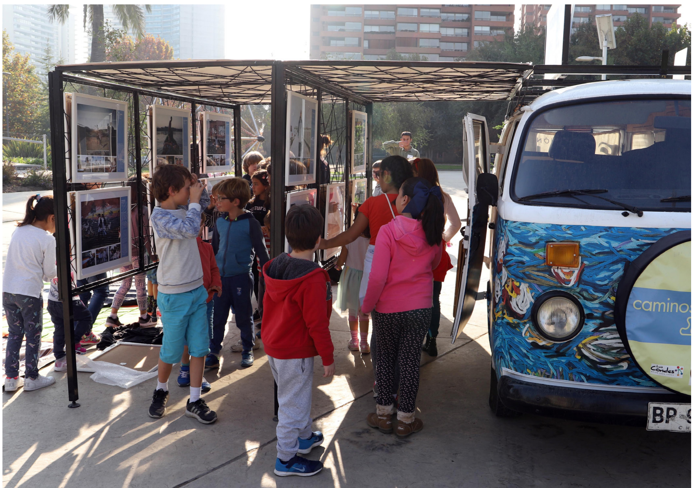
Arte sobre Ruedas | Visita mediada, exposición "Caminos a la escuela" | Las Condes